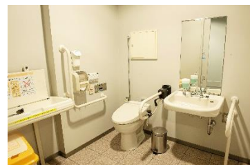
バリアフリースイレ