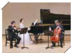
練馬区演奏家協会コンサート クララ・シューマンと仲間たち (2019年10月19日練馬文化センター小ホール)

練馬文化センターや大泉学園ゆめりあホールを会場に、練馬区演奏家協会会員の企画によるクラシックコンサートを実施しています。今年度はショパン、ベートーヴェン、武満徹をテーマに、本格的な音楽を楽しめるプログラムとなっています。