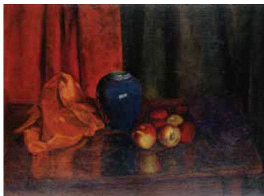
木村荘八《静物》1919年 油彩・キャンバス