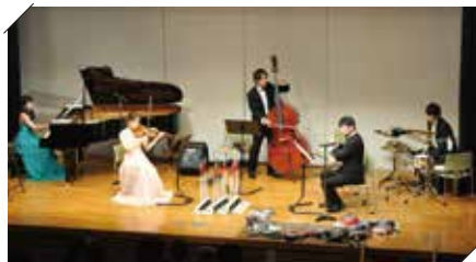
まちなかコンサート Vol.39 in 関区民ホール (2020年7月11日関区民センター)