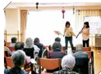
福祉施設への演奏家等派遣事業

コンサート会場に行くのが難しい方々も生演奏を楽しめるよう、福祉施設等への演奏家の派遣や区立施設や区内のイベントへの演奏家のあっせんを行っています。