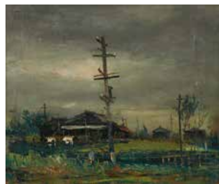
佐伯祐三《下落合風景》大正15年(1926)頃 油彩、キャンバス 東京国立近代美術館寄託

展覧会および関連イベントの最新情報、ご来館にあたっての注意事項等につきましては、施設のホームページをご確認ください。掲載情報は、2020(令和2)年12月11日現在のものとなります。