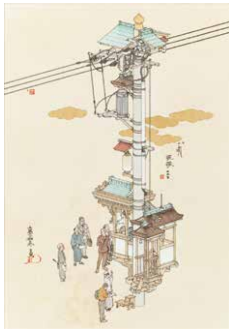
山口晃《演説電柱》平成24年(2012) ペン、水彩、紙 個人蔵 ©YAMAGUCHI Akira, Courtesy of Mizuma Art Gallery