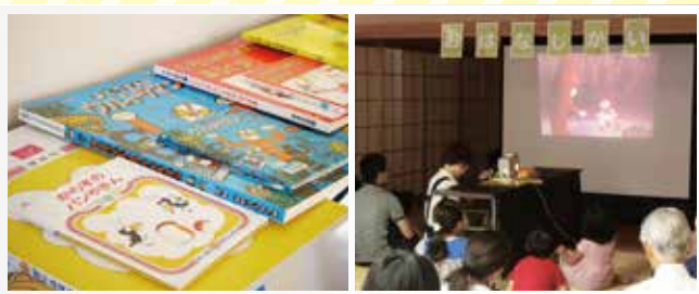
今回は「お仕事」に関連した絵本がずらり、いつもより大きな絵本もあります。(左) 会場が和室だった頃は、スライド紙芝居が大人気でした。(右)

「絵本とあそぶ会」では毎回テーマを決めて絵本を選び、分室で展覧会が行われていればそれにちなんだ作品などが選ばれます。今回のテーマは、翌日の“勤労感謝の日”にちなんで「お仕事」に。さて、どんなお話がそろったのでしょうか……？