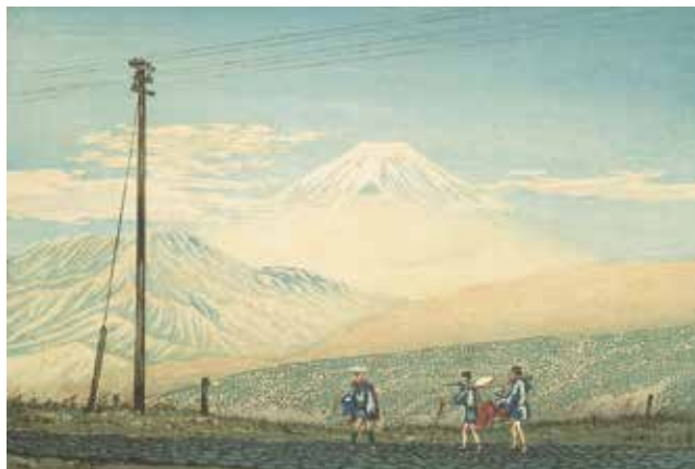
小林清親《從箱根山中富嶽眺望》明治13年(1880) 大判錦絵 千葉市美術館蔵

ペリーがもたらした電信機の実験が横浜で行われました。嘉永7年(1854)に描かれた日本初の電信柱、電線の絵をご覧ください。