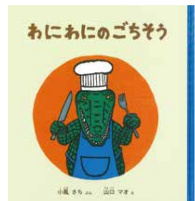
『わにわにのごちそう』(福音館書店2007年)表紙