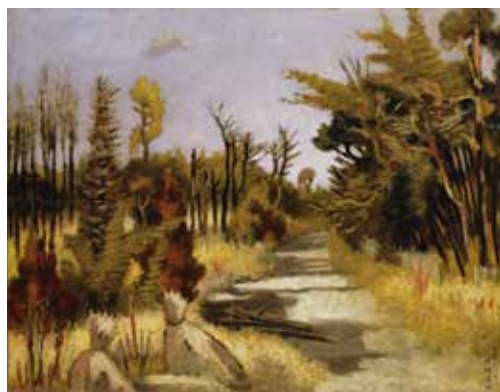
田嶋廣助《武蔵野の早春》1940年 油彩・キャンバス

1年毎に一つの展覧会出品作を取り上げ、35年間の練馬区立美術館の歴史を振り返ります。1985年の「田嶋廣助展」から1993年の「木村荘八展」、2007年「讚美小舎 上田コレクション」、2015年の「小林清親展」など、作品とともに当時のチラシやポスターも展示します。