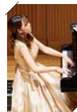
第63回ワンコイン・コンサート (2020年7月18日大泉学園ゆめりあホール)

0歳から楽しめる親子向けプログラムと大人も楽しめる本格的なプログラムによる、ワンコインで気軽に楽しめるコンサートを開催しています。