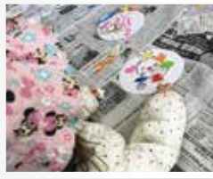
ロビーでは応援グッズを作る工作コーナーも