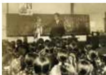
石神井西尋常小学校アrahamaより