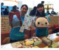
当日は運営ボランティアも活躍

今年で5年目を迎える「ねりパフォ」。運営も公募で集まった区内の若者が行なっています。これまで以上に盛り上げたい！という運営委員の皆さんが、ロビーでは応援うちわ作りや昔あそびコーナーを企画。ステージだけでなく応援に来た方も小さなお子さんで楽しめるアイデアがいっぱいでした。 出演者からは「こんな大きなステージで踊れるのはねりパフォだけ！また来年も出演したいです」という声も聞くことができました。