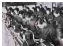
東京高等無線電信学校 モース印字機による送信機の練習 昭和14年