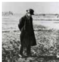
宮沢賢治

宮沢賢治(1896～1933)の作品とそこに至る人生には、友人たちとのつながりが深く関わっている。本展では、盛岡高等農林学校時代の友人や、詩人・草野心平とのつながりなどを紹介します。