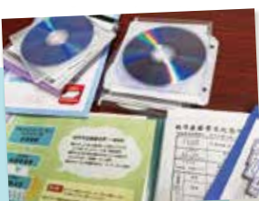
熱い思いの詰まった応募書類

演者を選ぶ審査会を運営しています。応募者から届いた書類と動画を元に出演者を決めます。今年は初出場も多数! パラエティ豊かなジャンルでお届けします。お楽しみに!