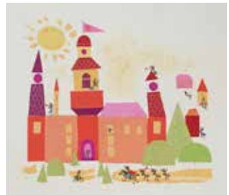
『しつけの本・かたち』(世界文化社、1972年) 挿絵原画