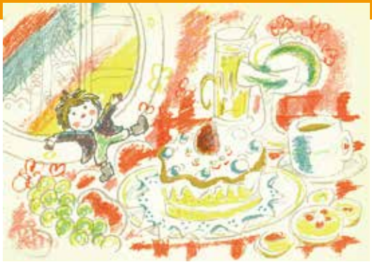
『さよならチフロ』(こくま社、1969年)