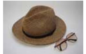
愛用の麦わら帽子とサングラス