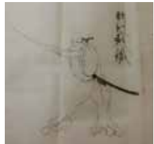
新除流面目録より 元和3年(1617年)(写本)