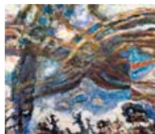
《電線風景》 1960年／油彩・カンヴァス 神奈川県立近代美術館

朝井のアトリエにある遺愛の品も展示します。絵に描かれた壺や人形の実物は一体どんなものか見比べてみてください。