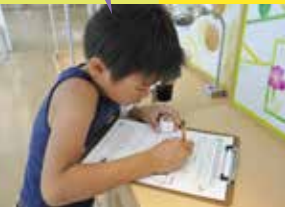
わがまち練馬情報コーナー1