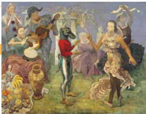
《丘の上》 1936年／油彩・カンヴァス／ 神奈川県立近代美術館

共催:読売新聞社・美術館連絡協議会 協賛:ライオン、大日本印刷、損保ジャパン日本興亜、日本テレビ放送網 協力:横須賀美術館 助成:芸術文化振興基金