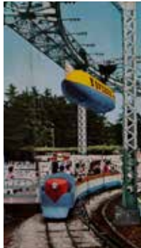
豊島園「空飛ぶ電車」昭和30年代頃

※「朝井開右衛門展 空想の宴宴」(練馬区立美術館)のチケット提示により100円引きとなります。