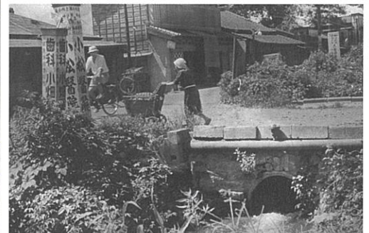
千川上水(桜台4-4付近・昭和28年)