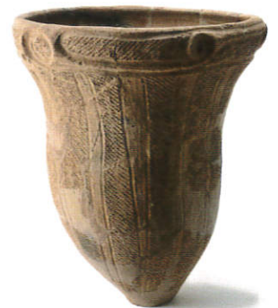
かそりいーしき 堀北遺跡（加曾利E式土器）