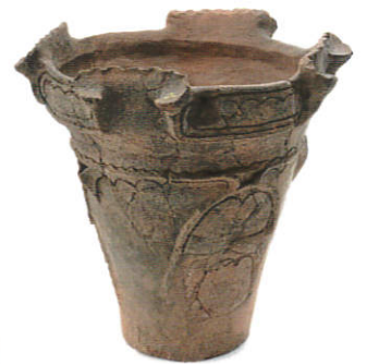
あたまだいしき 川北遺跡（阿玉台式土器）

*このほか、ワークショップ、展示解説会などを開催します。 詳しくは、本展チラシ、当館ホームページ、またはねりま区報6月21日号をご覧ください。