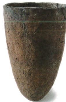
よりいともんけい 尾崎遺跡（撚糸文系土器）