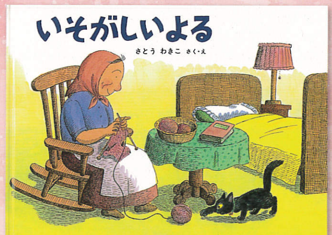
『いそがしいよる』 (福音館書店1981年)