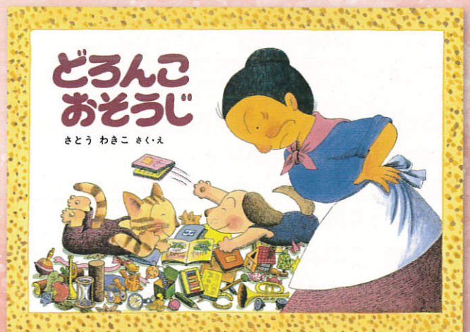
『どろんこおそうじ』 (福音館書店1986年)