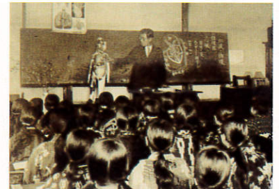
石神井西尋常小学校アルバムより