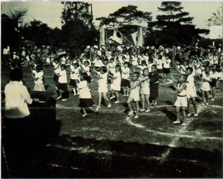
石神井西尋常小学校アルバムより