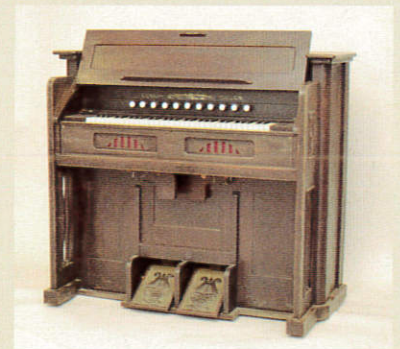
練馬区登録文化財 石神井西尋常小学校のリードオルガン

*詳しくは、本展チラシ、当館ホームページ、またはねりま区報4月11日号をご覧ください。