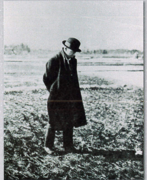
宮沢賢治