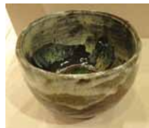
区長賞 箸方 海三氏作 『めん鉢“ふるさと遠望”』

来年度も、手工芸公募展の開催を計画しており、平成30年6月頃に作品募集し、9月に展覧会を開催する予定です。今年度出品されなかった方もぜひご出品ください。