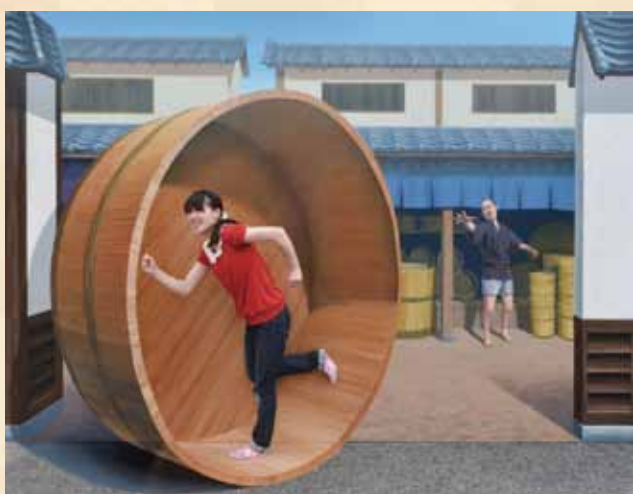
【トリックアートの世界】桶泥棒