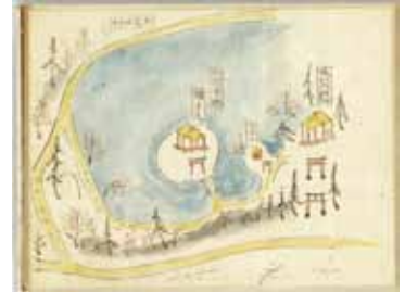
「武蔵野古物」部分(東京都公文書館蔵)