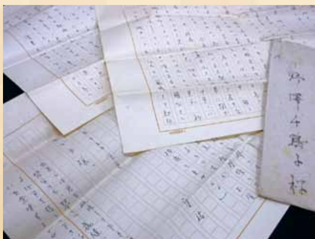
五味康祐書簡(野澤千鶴子あて) 1948年 部分