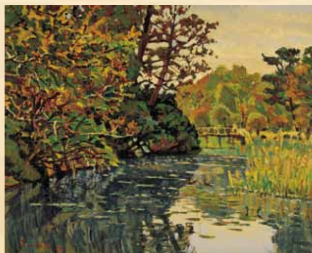
中村善策「池畔新緑」 (練馬区立美術館蔵)