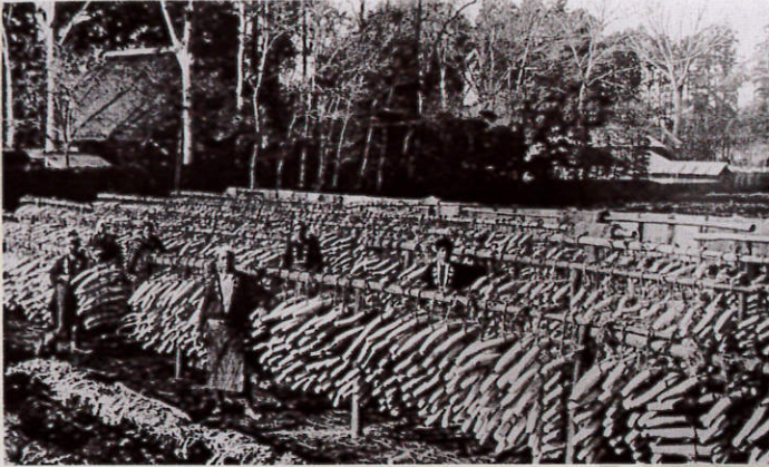
練馬大根の日干し風景 昭和10年頃