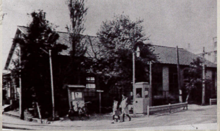
区役所仮庁舎（開進第三小学校講堂） 昭和22年頃