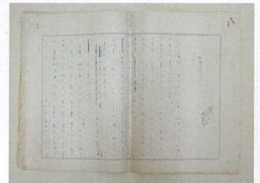
いぬいとみこ『木かげの家の小人たち』草稿