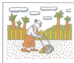
「ルラルさんのにわ」 (ポプラ社2001年)部分

本展では、代表作の原画約50点のほか、書籍や自作オブジェを展示し、「わくわく」の広がる世界をご紹介します。