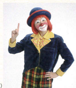
ピエロ(クラウン・トガ)

*このほか、区内遊園地の散策や展示解説会も開催します。詳しくは、本展チラシ、当館HPまたは9月11日号の区報をご覧ください。