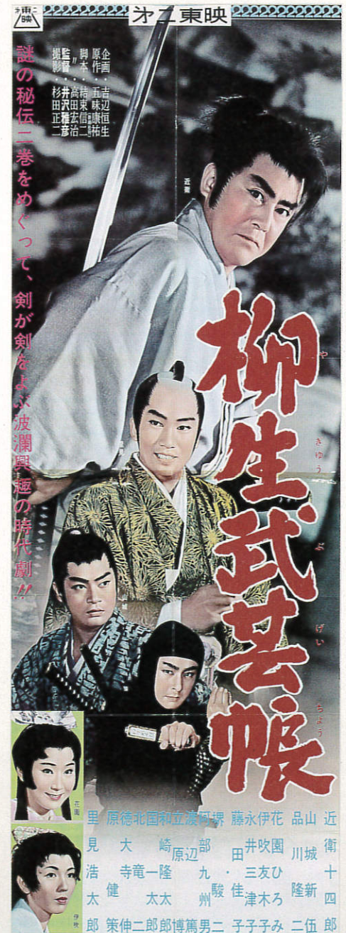
映画「柳生武芸帳」ポスター 昭和32(1957)年 第二東映