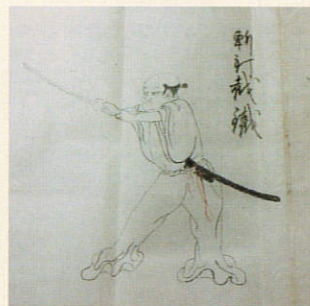
新陰流画目録 元和3(1617)年のものの写本

[送付先]〒177-0045 練馬区石神井台1-33-44 石神井公園ふるさと文化館分室 メール event-bunshitsu@neribun.or.jp