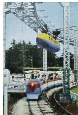
豊島園「空飛電車」 昭和30年代頃