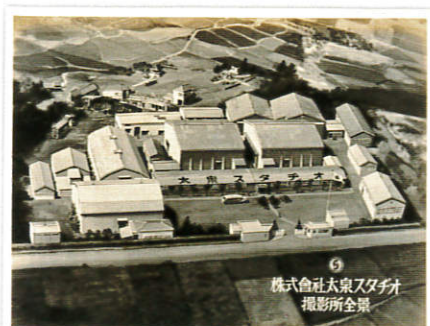
太泉スタジオ撮影所全景（昭和22～25年）

練馬区東大泉にかつてあった、新興キネマや太泉映画などに関する雑誌やちらし等、当館初公開の資料を含め、当時の実物資料から展示、紹介します。