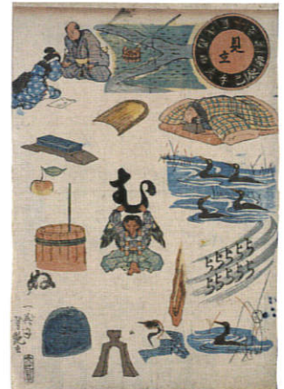
判じ絵「十二支見立」蛇足庵蔵 じゅうにし 十二支が絵であらわされています。

練馬区立美術館で開催の「国芳イズム—歌川国芳とその系脈 武蔵野の洋画家 恵 俊彦 コレクション」（会期：2月19日（金）～4月10日（日））のチケットをご提示で、各種料金から100円引きとなります。また、本展チケットを練馬区立美術館の上記展覧会にてご提示で、各種料金から100円引きとなります。（1枚につき1名様有効）