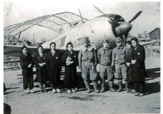
成増飛行場の搭乗員と面会の女性（昭和18年）練馬区蔵

終戦70年を機に、戦時下の生活資料、練馬区域の子どもたちの学童疎開、昭和18（1943）年に首都防衛のため現光が丘に建設された成増飛行場などから、戦時下の練馬区域の様子を紹介します。