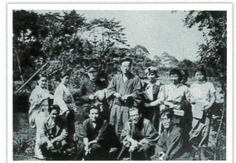
石神井公園・三宝寺池での檀一雄、太宰治らの「青春五月党」の集まり（昭和12年）