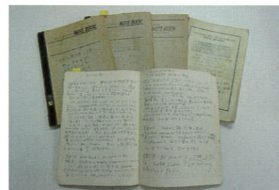
田中小実昌関係資料（日記）