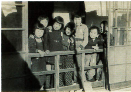
学童疎開先にて（昭和20年）