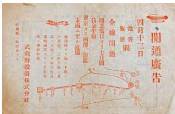
武蔵野鉄道開通広告 大正4(1915)年 池袋駅・飯能駅間開通の際の広告

今回の展示では、西武池袋線その他、西武新宿線、東武東上線に関する沿線案内図・切符、沿線の絵葉書などの収蔵資料を中心に、練馬区域と鉄道との関わりを紹介します。