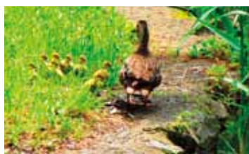
三宝寺池のカルガモ親子 (H26.5.23投稿)