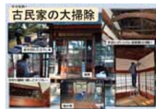
古民家の大掃除 (H26.12.19投稿)