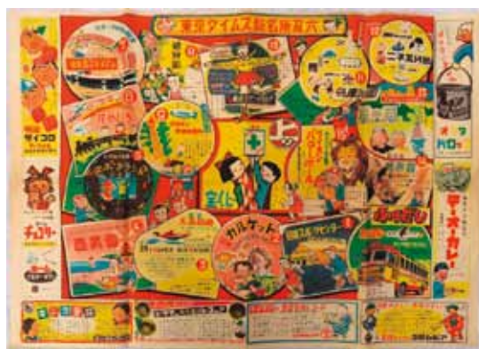
東京タイムズ新名所双六 昭和30(1955)年 西武鉄道沿線の豊島園や西武園などが紹介されている