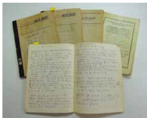
田中小実昌 日記 昭和58(1983)年ほか

講 師：檀太郎氏(エッセイスト) 日 時：平成27年6月6日(土) 14時～15時30分 会 場：石神井松の風文化公園管理棟2階多目的室 定 員：100人(抽選) *申込方法等、詳細は当館ホームページをご覧ください。