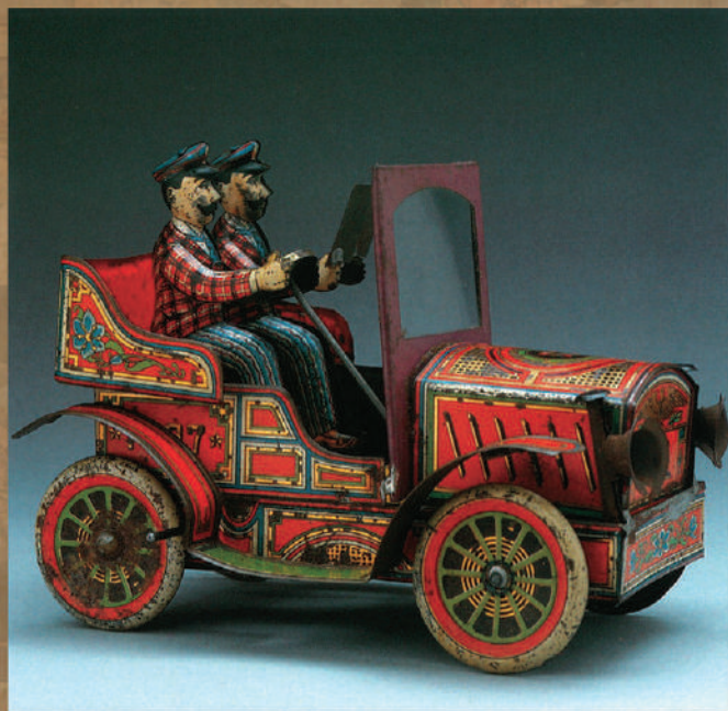
ブリキの自動車(昭和戦前期)