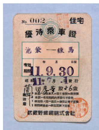
武蔵野鉄道優待乗車証