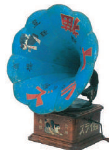
昭和戦前期の蓄音機 (ブリキのおもちゃ博物館所蔵)