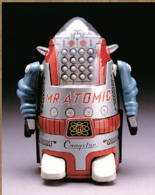
ブリキのロボット(高度経済成長期前半)