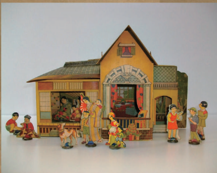
紙のおうち(昭和戦中期)

9月21日から11月17日まで開催の特別展「懐かしの風景 北原コレクションの世界」展では、昔懐かしいおもちゃをはじめ、時代を感じさせるポスターなどの数々をご覧ください。ぜひご来館ください。