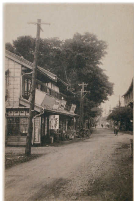
景ノり通田古江村橋板上