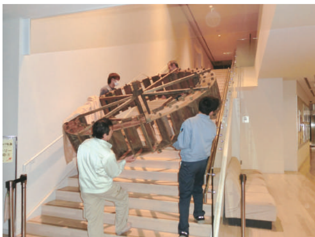
常設展示室へ運ばれる水輪

水輪は、水の流れを受けて回る部分です。練馬は武蔵野の乾いた台地上にあり、決して水に恵まれているとはいえません。そのような土地柄でも、練馬の人々は、河川や用水の水を利用し、水車を製粉・精穀の他、伸銅・生糸揚返などの動力として活用しました。