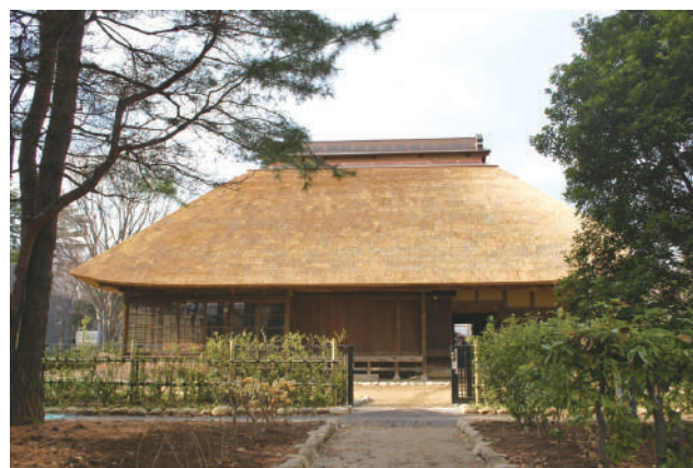
練馬区指定文化財「旧内田家住宅」

東京文化財ウィーク企画事業です。東京都23区内で古民家を文化財として指定・登録している9区(足立区・板橋区・江戸川区・北区・江東区・杉並区・世田谷区・目黒区・練馬区)の各古民家を紹介したパネルを展示します。期間中、古民家解説会などの事業を行います。各古民家の特徴を見比べてみませんか。